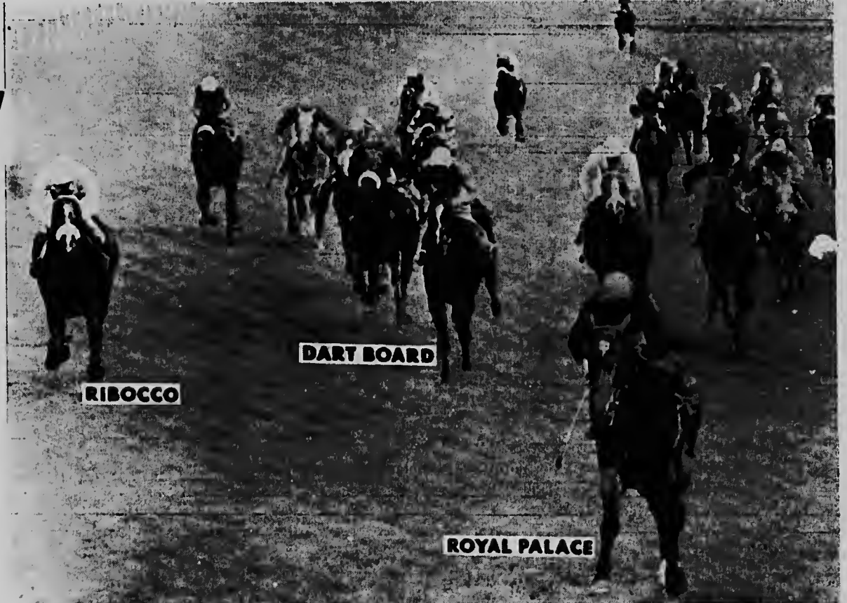
EPSOM, Inglaterra, E favorito Royal Palace, conduci pa e jinete australiano George Moore a gana e 250.000 dollar di Epsom Derby cu dos curpa y mei di ventaha, Ribocco a yega na e segundo puesto y Dart Board a clasifica na e segundo puesto.

E posicionnan a keda asina te ora nan a jega na e famoso Codo de Tattenham (ultima curva) Piggott a cuminsa su carga, pero tan pronto cu el a hasi esaki, personanan cu tabata den e estadio, entre cual tambe reina Isabel a compronde cu e carreda a caba.